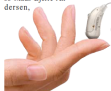
Starke Leistung und innovative Technik im Miniaturformat: das neue Pure.

Die modernen Geräte tragen sich nicht nur gut, sie werden auch immer kleiner. Das neue Pure von Siemens ist das jüngste nahezu unsichtbare Hörgerät im Miniaturformat: Es verbindet kleinste Bauweise und maximale Leistung. Bestes Sprachverstehen, ein natürlicher Rundumklang und höchste Klangqualität in allen Situationen liefern brillante Hörerlebnisse.